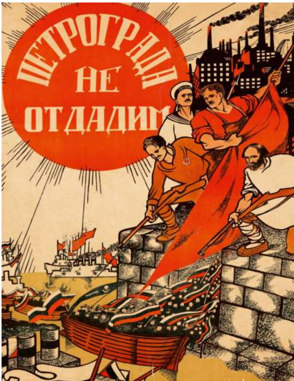
ديمتري مور Dmitry Moor (لن نتخلى عن بتروغراد) ، طباعة حجرية ، ١٠٣ × ٦٩.٥ سم ، عام 1917