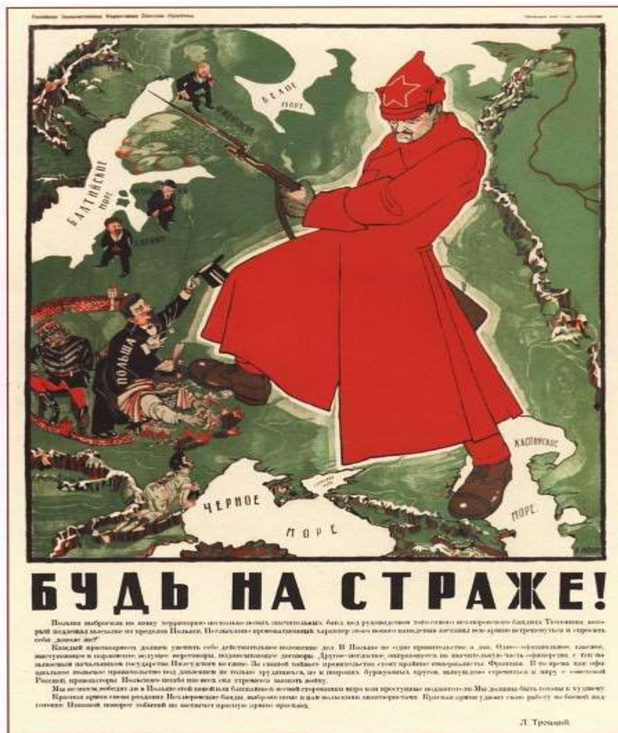
232. Moor Д. Будь на страже! 1920

104 ديمتري مور (کن علی أهبة الاستعداد)، طباعة حجرية ، 1920 × 67 سم ، عام 1920