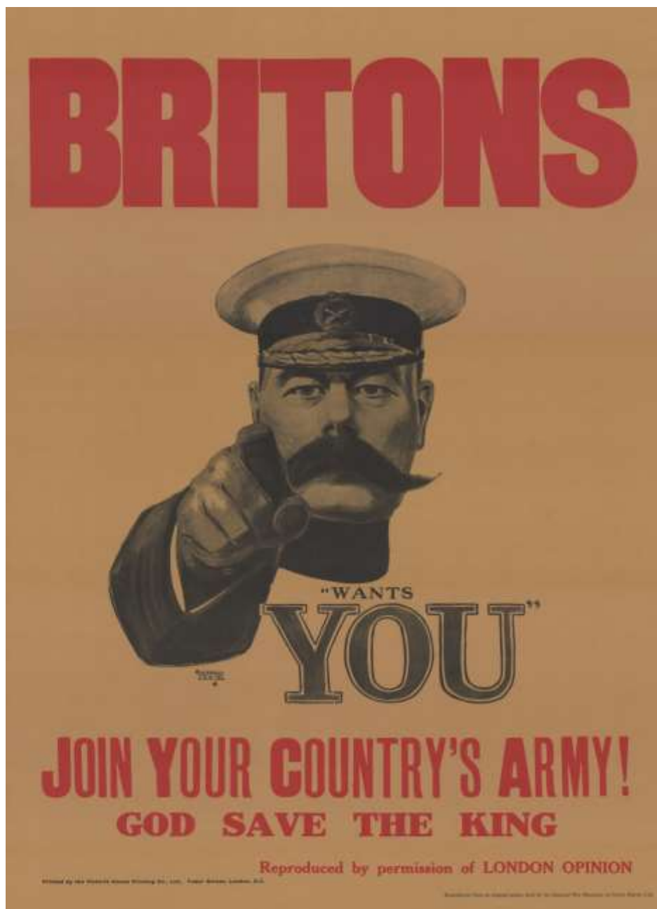
شكل ( 3 ) ألفريد ليت Alfred Leete ( أيها البريطانيون: اللورد كيتشنر يطلبكم)، طباعة حجرية ، 74 × 50 سم ، عام 1914