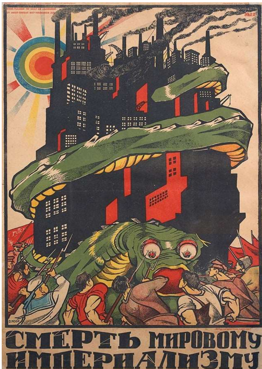
شكل ( 5 ) ديمتري مور Dmitry Moor (الموت للإمبريالية العالمية) ، طباعة حجرية، 91 × 62 سم ، عام 1919